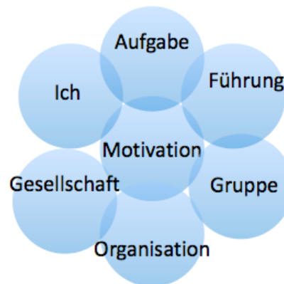
Abb. 1: Quellen der Motivation 5

schwer überschaubares Konstrukt handelt, welches von vielen verschiedenen Faktoren beeinflusst wird und gleichzeitig mit diesen in einem engen Zusammenhang steht. 4