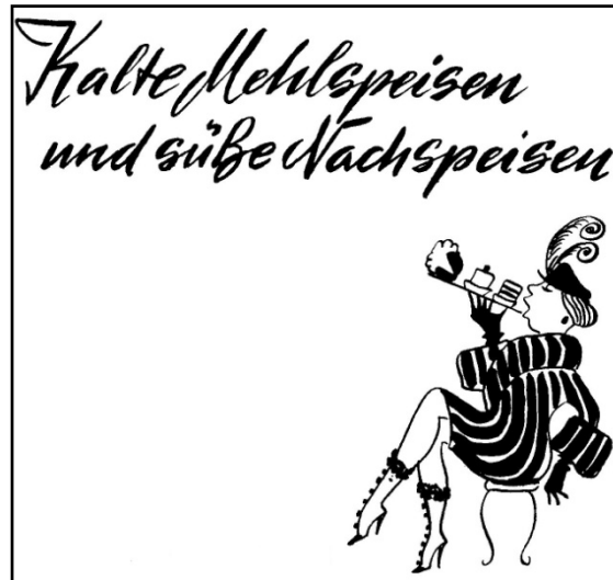
Abbildung 1: "Naschen ist weiblich", aus Hofer, Feinschmecker-Spezialitäten, 165.

Werbung eingesetzt (zum Beispiel in Elisabeth Heinrichs Buch). Die meisten Bilder aber dienen als Darstellung von im Text enthaltenen Informationen, die so visualisiert und hervorgehoben werden. Dies kann zum Beispiel ein bestimmter Zubereitungsschritt beim Kochen sein, einzelne Zutaten zu einem Gericht oder am häufigsten die fertige Speise. Ein paar dieser Bilder möchte ich hier nun gerne vorstellen und näher besprechen.