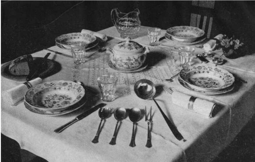
Abbildung 2: "Einfach gedeckter Familientisch", aus Duch, Wiener Kochbuch, 290.

Fortfahren möchte ich allerdings mit einem ganz anderen Bild, das in Form eines Schwarz-weiß-Fotos im Kochbuch von Karl Duch eingefügt ist: