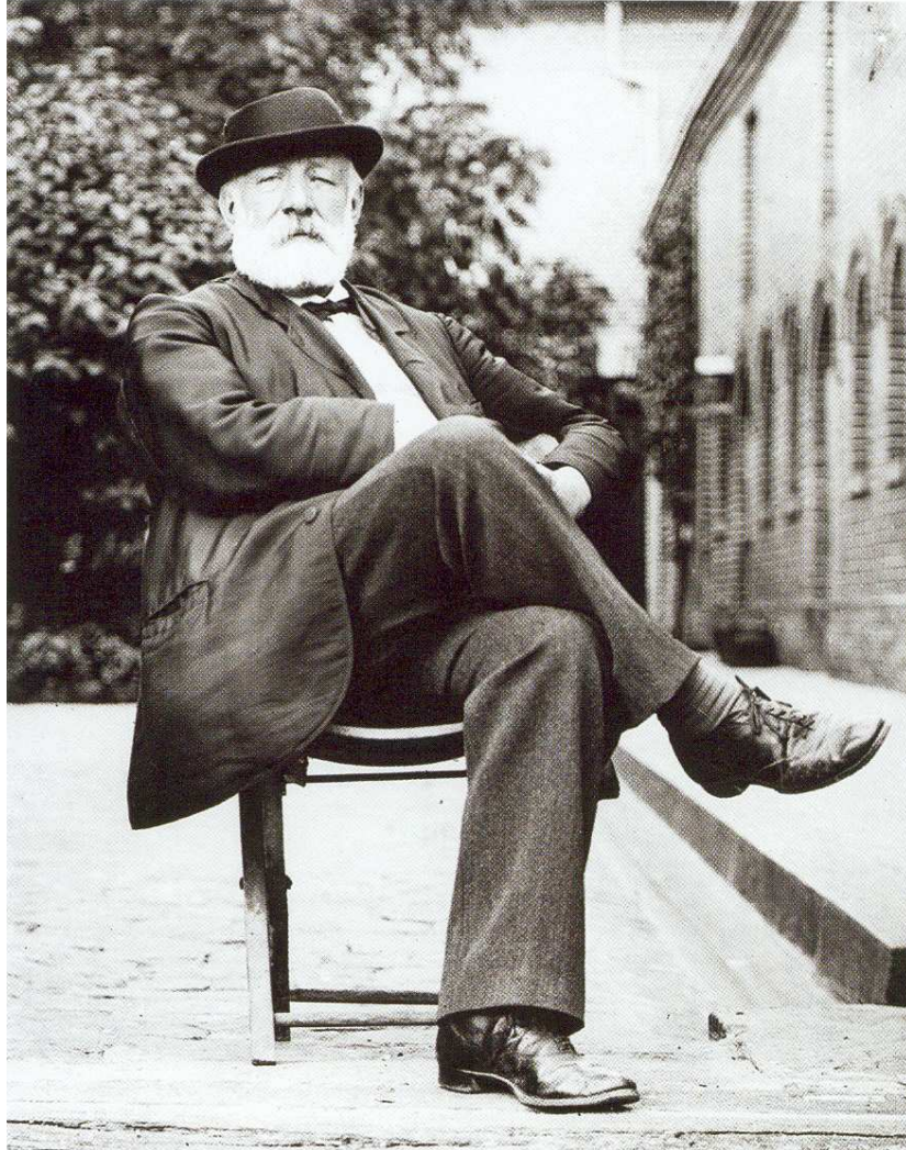
Jules Verne dans la cour de sa maison vers 1896 93